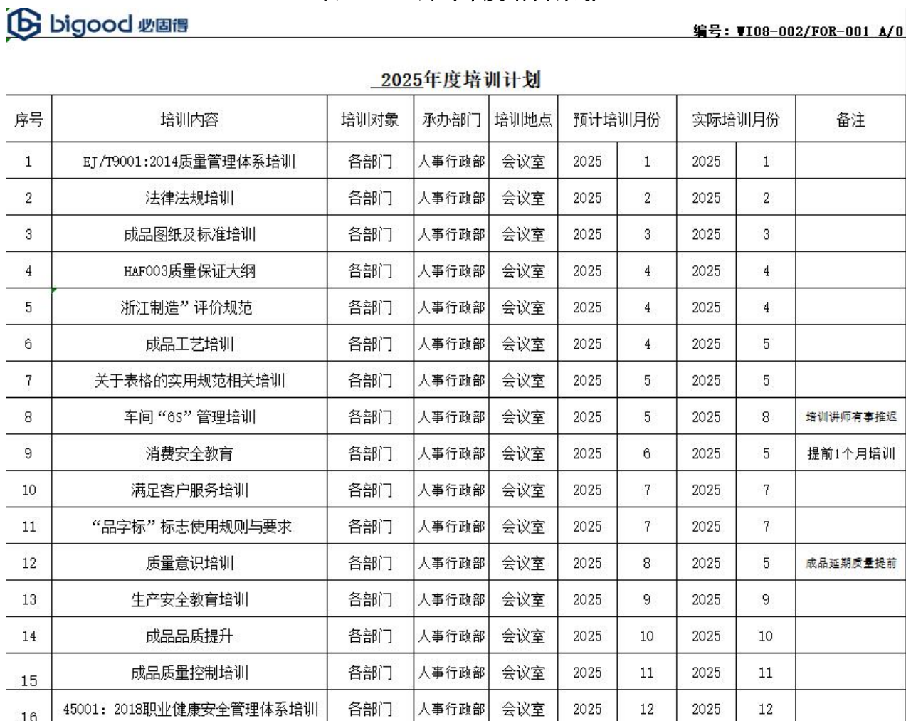
表 3.2-1 公司年度培训计划

根据公司教育培训方案对全体员工进行了质量诚信和质量意识方面的教育培训，做到有计划，有安排，有检查，有考核，有总结，确保了培训效果和质量。